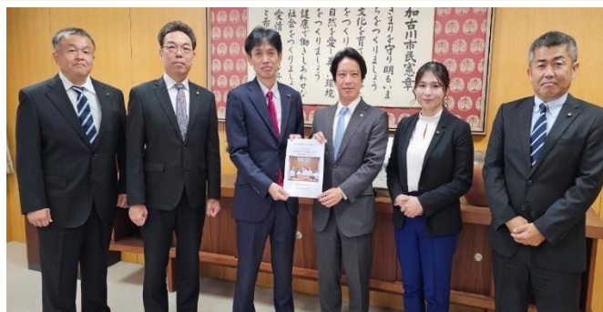
(令和5年10月：市長に対し政策提言)

私が所属する「かこがわ市民クラブ」では、市民の方々から寄せられたご意見やご要望を基に、令和6年度の政策・予算に反映されるよう、 71項目 を重要政策提言書にまとめ、岡田市長へ提出、意見交換いたしました。