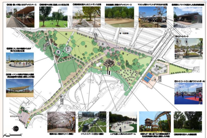
（第1期エリア：整備イメージ図〈修正版〉）

第1期の再整備： 公園第1駐車場に面したエリアを中心に、芝生広場や大型遊具の設置及び飲食店などを設置予定。また、現在の第2テニスコート管理棟周辺にニュースポーツゾーンの整備が行われます。