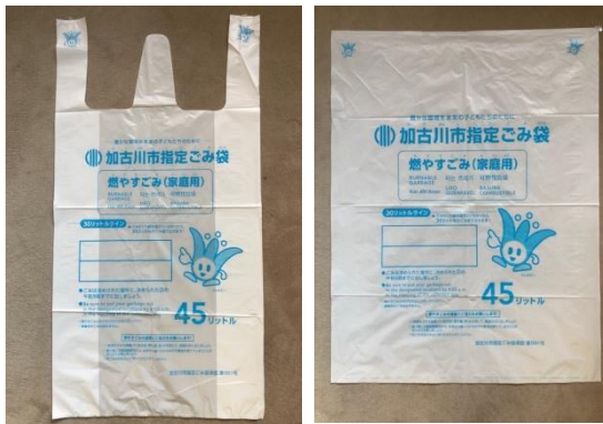
指定ごみ袋 *左側：レジ型、右側：平型

A：指定ごみ袋制度への理解が徹底されることが課題であると認識しており、町内会にはのぼりやポスターを多くのごみステーションに掲示していただいています。また、連合町内会を対象に、説明会を継続して実施する等、様々な機会を通じ制度の完全実施まで、引き続き周知に努めます。