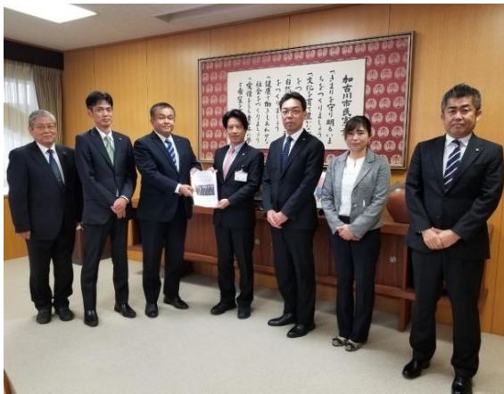
市長に対し会派政策提言

(国道2号線4車線拡張工事の推進、各基幹道路の整備、JR加古川駅周辺の市街地整備の推進 等)