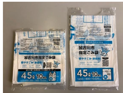
(10枚入り) *左側：レジ型、右側：平型